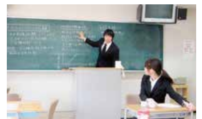
※2019年以前の写真です。企画や授業は感染対策をしています。