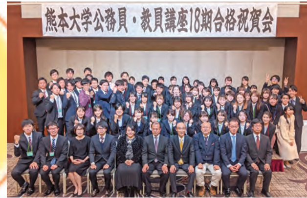
※新型コロナウイルス感染症拡大防止のため2021年以降は実施していません。合格祝賀会