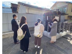
▲情報収集のために坂本キャンパス見学をした際の写真

再始動して初めての新学期を迎えますが、 生協組織部を経験した職員がサポートすることで活動に対する不安を解消しながら、再スタートが切れています。