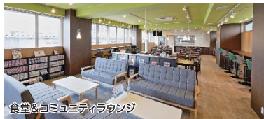
食堂&コミュニティラウンジ

【内訳】敷金なし(禁煙特約あり)/入館1年:10万円 2年:15万円/年間管理費15.6万円/仲介手数料1ヶ月分(税別)/退去時基本清掃料38,000円(税別)/保証委託料月額費用50%/除菌施工費13,000円(税別)/電子錠初期設定費9,000円(税別)/前家賃/24時間サポート14,400円(税別)